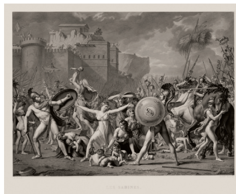
Raphael Urbain Massan 1775–1843

Sabinele despărțindu-i pe sabini de romani, după J.L. David gravură 58 × 77,5 cm