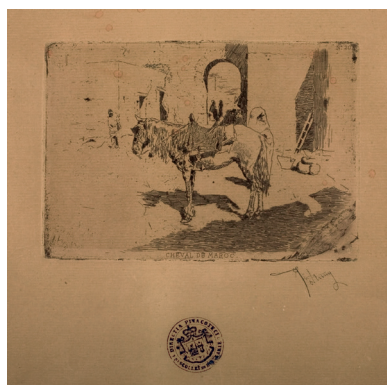
Mariano Fortuny 1871–1949

Cheval du Maroc gravură acvaforte 45 × 62 cm