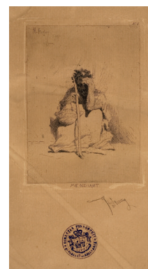
Mariano Fortuny 1871–1949