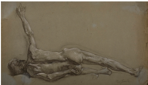
Pan Ioanid 1878–1956

Studiu de nud culcat desen în cărbune și cretă albă pe hârtie 53,5 × 61 cm