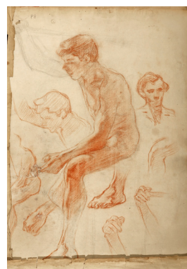
Pan Ioanid 1878–1956

Studiu de bărbat culcat cărbune pe hârtie 59 × 43,5 cm