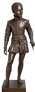
François Joseph Bosio 1768–1845