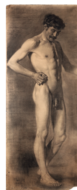
Pan Ioanid 1878–1956

Henric al IV-lea, copil [Henric de Navarre] bronz patinat 117 × 42 × 34 cm