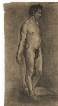
Pan Ioanid 1878–1956

Studiu de nud desen în cărbune pe hârtie 120 × 66 cm