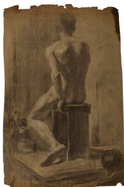
Pan Ioanid 1878–1956

Studiu de nud în atelier desen în cărbune pe hârtie 67 × 44 cm