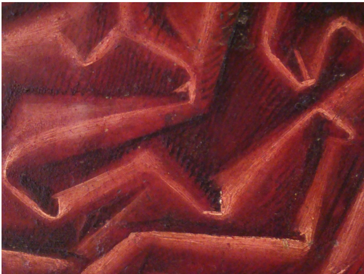
Tempera cu ou / tempera grasa